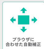
ブラウザに合わせた自動補正

ページのタイトル一覧を左サイドナビゲーションに表示します。複数の連番のページをひとまとめにし、オープンクローズ機能によって目次の見やすさを向上させるグループ機能も利用可能です。