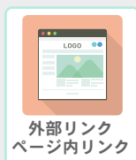
外部リンク ページ内リンク