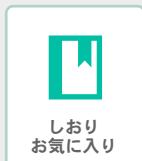
しおり お気に入り